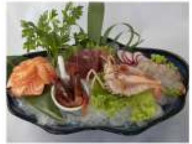
119/ Sashimi speciale €24,90 9 fette di sashimi, 2 gambero rosso 1 scampo Allergeni: 2