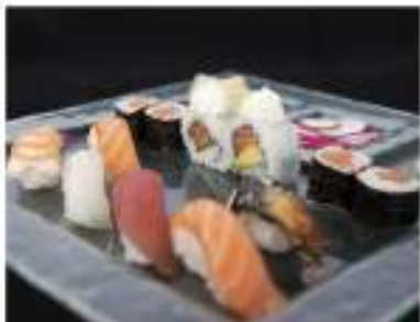
104/ Sushi misto €10,00 6 nigiri, 4 hosomaki, 2 uramaki Allergeni: 2