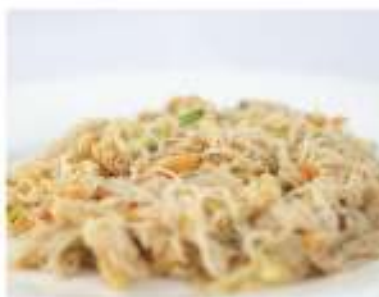
158/ Spaghetti di riso con verdure €5,00 Allergeni: 1