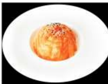
112/ Sake don €10,00 Base di riso con sashimi di salmone Allergeni: 11