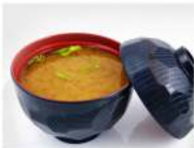
33/ Miso shiru €3,00 Zuppa di miso