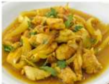
183/ Pollo al curry €5,50