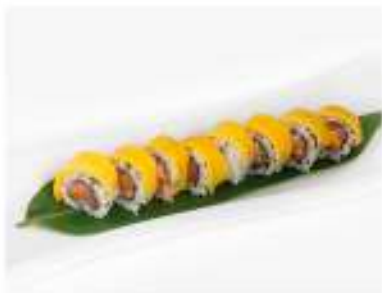
77/ Mango pistacchio roll (8pz) €12,00 Roll di riso farcito con salmone, avocado e philadelphia avvolto con mango e pistacchio in pezzi e salsa di mango Allergeni: 8