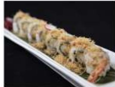
71/ Uramaki ebiten B (8pz) €9,50 Roll di riso farcito con gamberoni fritti maionese, salsa teriyaki e pasta katai Allergeni: 1, 2, 3, 6, 11