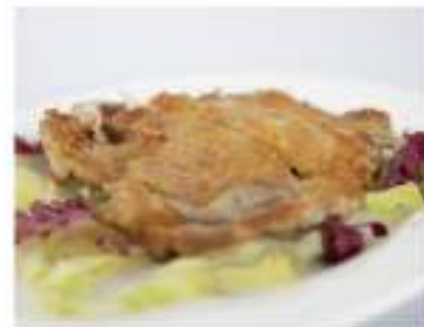
172/ Tonkatsu €7,50 Cotoletta di maiale frita Allergeni: 1, 3