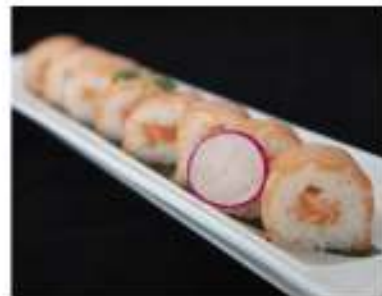
90/ Salmon fresh (8pz) €9,00 Roll di riso farcito con salmone