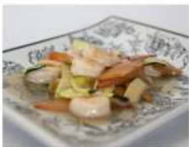
176/ Gamberetti alle verdure €6,00 Allergeni: 2