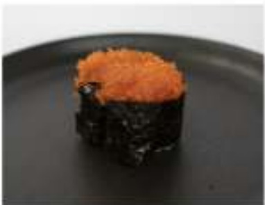
134/ Gunkan tobiko €5,50 Bocconcini di riso con alga nori guarniti con uova di pesce volante