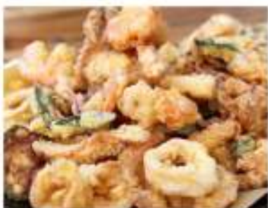
170/ Tempura di mare €11,00 Pesce misto fritto Allergeni: 1, 2