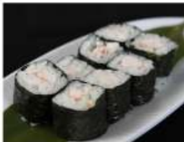
46/ Hosomaki ebi (8pz) €4,00 Roll di riso farciti con gamberetti cotti e avvolti con alga nori Allergeni: 2, 6