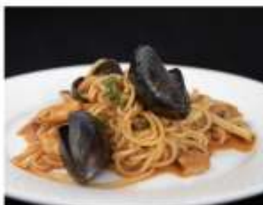
161/ Spaghetti ai frutti di mare €8,50 Allergeni: 1, 2, 14