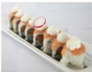
72/ Uramaki philadelphia (8pz) €10,00 Roll di riso farcito con salmone avocado e philadelphia Allergeni: 7, 11