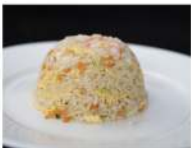
144/ Riso con gamberi €4,50 Riso saltato con gamberi e verdure Allergeni: 2, 3