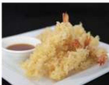
171/ Ebi tempura €10,00 Tempura di gamberoni Allergeni: 1, 2