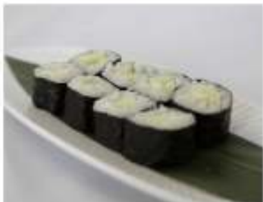
45/ Hosomaki kappa (8pz) €4,00 Roll di riso farciti con cetriolo e avvolti con alga nori