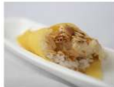
103/ Temaki gamberi fritti €4,50 Cono di riso avvolto da sfoglia di soia con gamberi fritti, mandorle e salsa teriyaki Allergeni: 2, 3, 8, 11