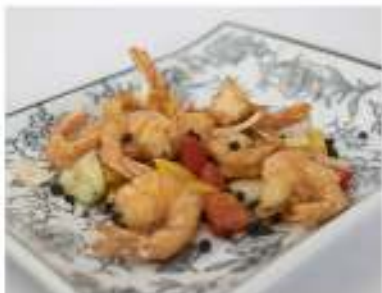
173/ Gamberetti sale e pepe €6,50 Allergeni: 2