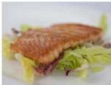
164/ Salmone alla griglia €6,50