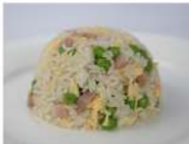
143/ Riso alla cantonese €4,00 Riso con piselli, prosciutto e uovo Allergeni: 3, 6