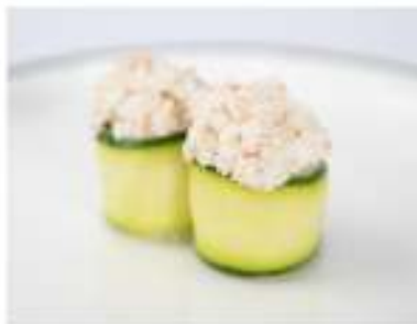
135/ Gunkan zucchine €5,50 Bocconcini di riso avvolti con zucchine guarniti con tartare di gamberetti, granchio e maionese Allergeni: 2, 3