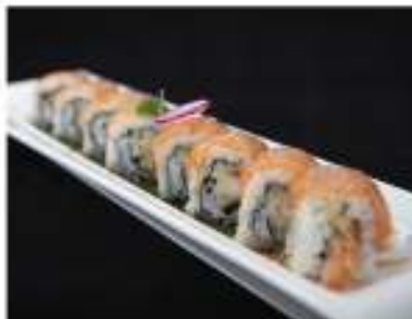
81/ Uramaki tiger roll (8pz) €12,00 Roll di riso farcito con gambero fritto e maionese, guarnito con salmone e condito con salsa teriyaki Allergeni: 1, 2, 3, 6