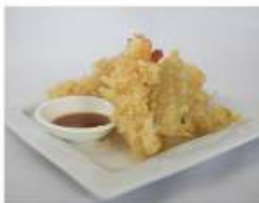
168/ Tempura mista €10,00 Tempura di gamberoni e verdure miste Allergeni: 1, 2