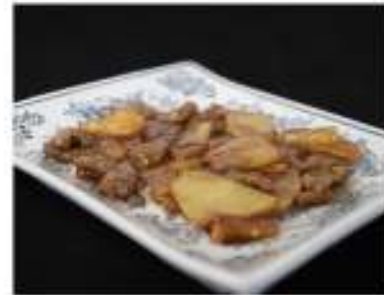
187/ Manzo con patate €6,50