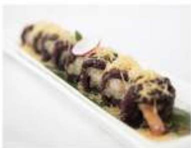
88/ Black ebiten (8pz) €10,00 Roll di riso venere farcito con tempura di gambero, maionese salsa teriyaki e pasta kataifi Allergeni: 1, 2, 3, 6