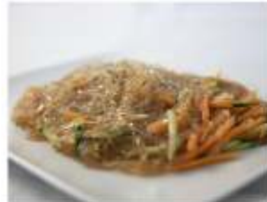
156/ Spaghetti di soia con verdure €5,00 Allergeni: 1, 6