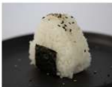
53/ Onigiri miura €5,00 Polpetta di riso triangolare con pasta kataifi, farcita con salmone saltato, cipolla e philadelphia Allergeni: 11, 7