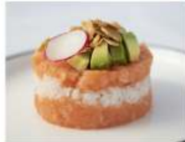
38/ Hamburger tartare €9,50 Riso, avocado, salmone e scaglie di mandorle Allergeni: 8