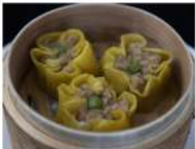
15/ Shao mai (3pz) €4,00 Ravioli ripieni di gamberi, carne di maiale e zafferano Allergeni: 1, 2, 3, 6