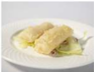
01/ Harumaki €3,50 Croccante involtino di pasta con ripieno di gamberi, carota e cipolla Alleggereni: 1