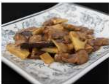
188/ Manzo con funghi e bambù €6,50