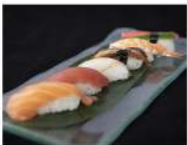
108/ Nigiri misto €7,00 6 nigiri misti Allergeni: 2