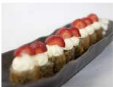
42/ Hosomaki strawberry (8pz) €6,00 Roll di riso avvolti con alga nori fritti, farciti con salmone e guarniti con philadelphia e fragole fresche con salsa teriyaki Allergeni: 1, 7