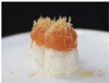
141/ Tamarizushi sake €5,00 Bocconcini di riso con tartare di salmone e maionese Allergeni: 3