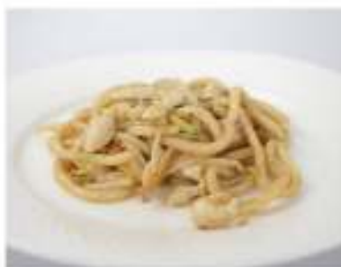
146/ Udon con pollo €7,00 Udon saltati con pollo e verdure Allergeni: 1