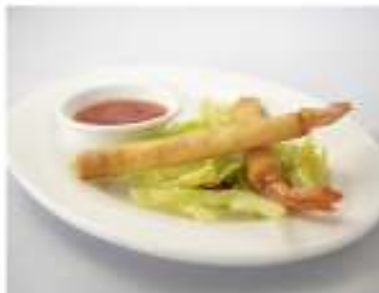
02/ Ebi stick €3,00 Gamberetti avvolti da pasta sfoglia con salsa orange Alleggereni: 1, 2