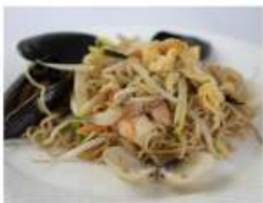
148/ Ramen ai frutti di mare €8,00 Ramen saltati con frutti di mare e verdure Allergeni: 1, 2, 14