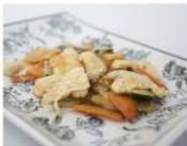
186/ Pollo e verdure €5,50 Pollo con verdure miste