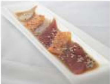
114/ Carpaccio misto €9,00 Fettine di pesce misto condite con salsa ponzu Allergeni: 6, 11