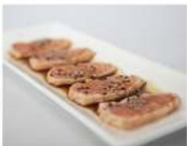
30/ Sake tataki €9,00 Salmone scottato con sesamo condito con salsa ponzu Allergeni: 6, 11