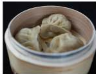
14/ Gyoza (3pz) €3,50 Ravioli ripieni di carne di maiale e verdure Alleggereni: 1, 3, 6