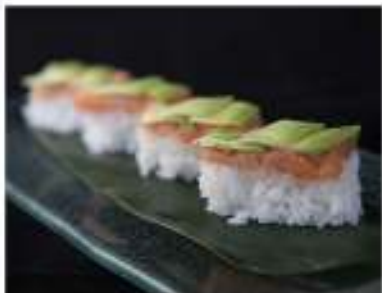
92/ Saudate (4pz) €13,00 Rettangoli di riso con spicy salmon e avocado Allergeni: 7