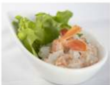
37/ Ebi tartare €6,00 Tartare di gamberi con salsa ponzu Allergeni: 2, 6, 11