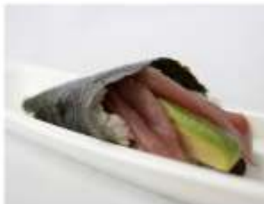
93/ Temaki maguro €4,00 Cono di riso avvolto da alga nori farcito con tonno e avocado