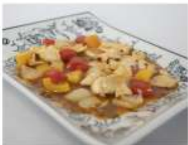
185/ Pollo in salsa piccante €5,50