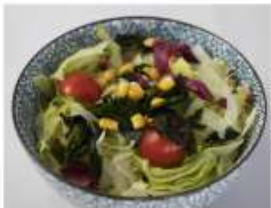
27/ Mikkusu salad €3,50 Insalata Mista