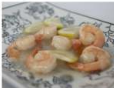
174/ Gamberetti al limone €6,50 Allergeni: 2