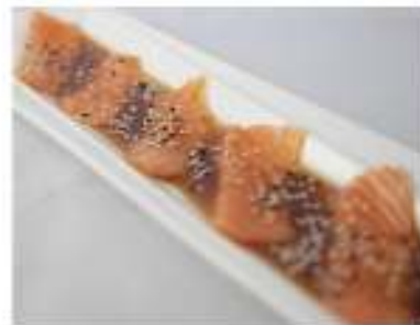
113/ Carpaccio di salmone €8,00 Fettine di salmone condite con salsa ponzu Allergeni: 6, 11