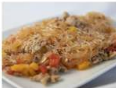
155/ Spaghetti di soia piccanti €5,00 Spaghetti di soia saltati con carne di maiale, cipolle e peperoni piccanti Allergeni: 1, 6