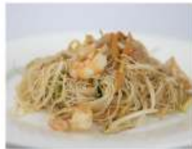
159/ Spaghetti di riso con gamberi e verdure €6,00 Allergeni: 1, 2, 3