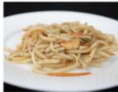
147/ Udon con gamberetti €7,00 Udon saltati con gamberetti e verdure Allergeni: 1, 2, 6