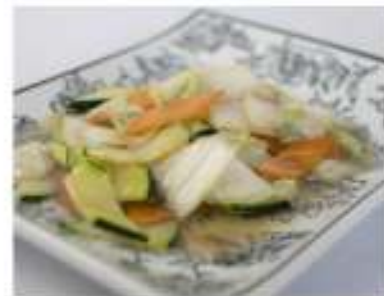
191/ Misto di verdure saltate €4,00 Verdure saltate con germogli di soia e funghi Allergeni: 6