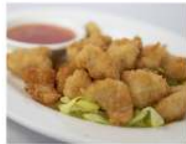
178/ Pepite di pollo fritto €5,50 Allergeni: 1, 3