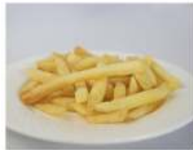
09/ Patatine fritte €2,00