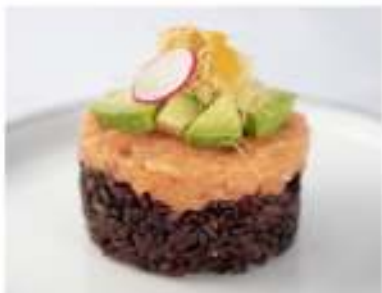
39/ Black tartare €9,50 Tartare di salmone con riso venere ricoperto con avocado, pasta kataifi e salsa al mango Allergeni: 1