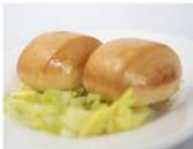
16/ Pane fritto €2,50 Pane dolce cinese con crema all'uovo Allergeni: 1, 3, 7