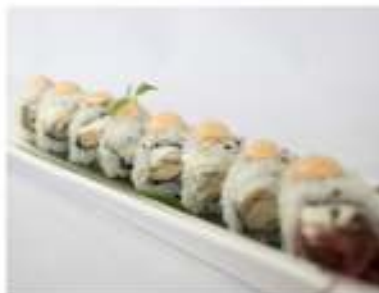
79/ Chicken roll (8pz) €8,00 Roll di riso farcito con pollo fritto philadelphia e salsa rosa Allergeni: 1, 6, 7, 11