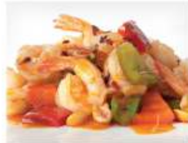
175/ Gamberetti in salsa piccante €6,50 Allergeni: 2