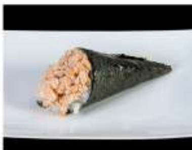
99/ Temaki miura €4,00 Cono di riso avvolto da alga nori con salmone grigliato e salsa teriyaki Allergeni: 6