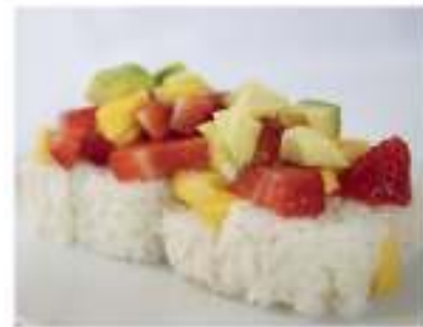
74/ It fruit (8pz) €14,00 Roll di riso farcito con banana, maionese, guarnito con fragola, mango e avocado Allergeni: 3