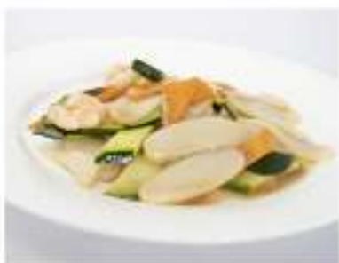
160/ Gnocchi €5,50 Gnocchi di riso con gamberi e verdure Allergeni: 1, 2