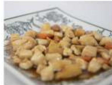
181/ Pollo alle mandorle €5,50 Pollo saltato con bambù e mandorle Allergeni: 8