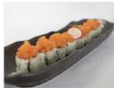
62/ Uramaki spicy salmon (8pz) €10,00 Roll di riso farcito con salmone maionese e tobiko(piccante) Allergeni: 3, 11