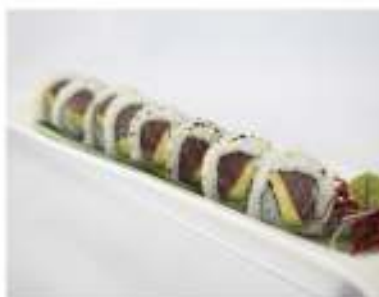
61/ Uramaki tonno avocado (8pz) €8,00 Roll di riso farcito con tonno e avocado Allergeni: 11