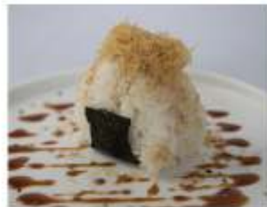
54/ Onigiri spicy salmon €5,00 Polpetta di riso triangolare farcita con salmone, maionese, tabasco e tobiko Allergeni: 3, 11