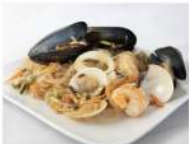
154/ Spaghetti di soia misto mare €6,50 Allergeni: 1, 2, 6, 14