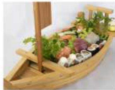
110/ Barca €20,90 9 sashimi, 6 hosomaki, 4 uramaki 6 nigiri, 2 gunkan Allergeni: 2