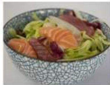
26/ Sashimi salad €7,50 Insalata con pesce misto crudo