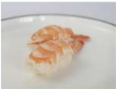
120/ Nigiri ebi (2pz) €3,00 Bocconcini di riso con gamberetto cotto Allergeni: 2