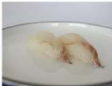
121/ Nigiri suzuki (2pz) €3,00 Bocconcini di riso con branzino