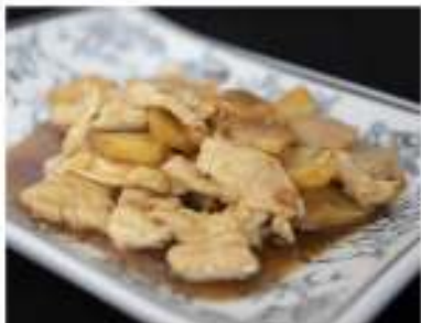
182/ Pollo con patate €5,50