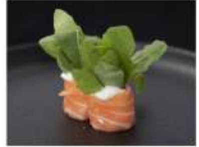
130/ Gunkan philadelphia e rucola €5,00 Involtini di salmone, guarniti con philadelphia e rucola Allergeni: 7