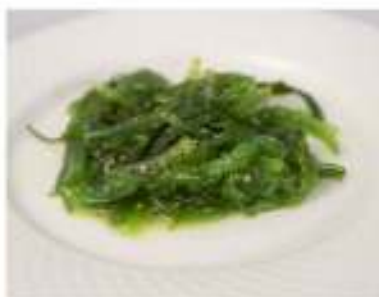
21/ Goka wakame €3,50 Alghe piccanti marinate con sesamo Allergeni: 11