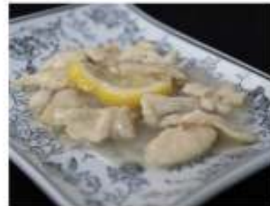
184/ Pollo con salsa al limone €5,50