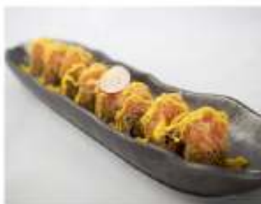
40/ Hosomaki fritto (8pz) €6,00 Roll di riso avvolti con alga nori fritti, farciti con salmone, guarniti con tartare di salmone e salsa alla zafferano Allergeni: 1