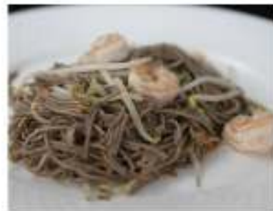
152/ Soba €7,00 Pasta di grano saraceno con gamberetti e verdure Allergeni: 1, 2