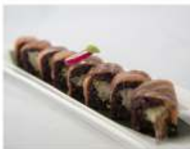
85/ Black tiger (8pz) €12,00 Roll di riso venere farcito con gamberoni fritti, maionese, guarnito con salmone e condito con salsa teriyaki Allergeni: 1, 2, 3, 6