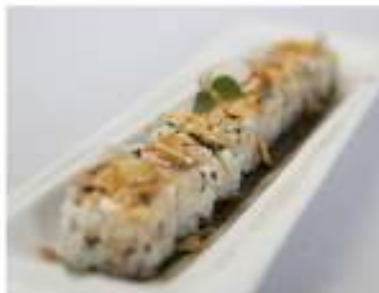
58/ Miura mandorle (8pz) €9,00 Roll di riso farciti con gamberetti cotti e avvolti con alga nori Allergeni: 6, 7, 8, 11