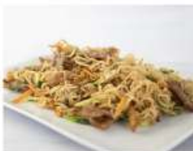
149/ Ramen con manzo €7,00 Ramen saltati con manzo e verdure Allergeni: 1