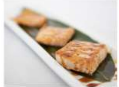
116/ Salmone scottato €6,00 Salmone scottato in salsa teriyaki Allergeni: 6, 11