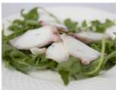
23/ Insalata di polpo €6,50 Insalata di polpo e rucola Allergeni: 14