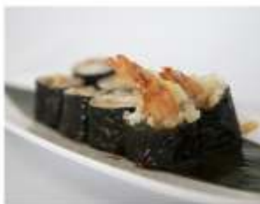
49/ Hosomaki ebi tempura (8pz) €5,00 Roll di riso farciti con tempura di gamberi, avvolti con alga nori e guarniti con salsa teriyaki Allergeni: 1, 2, 3, 6