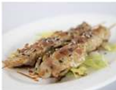
180/ Yaki tori €7,00 Spiedini di pollo con salsa teriyaki Allergeni: 6