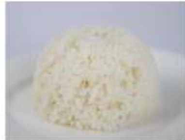
142/ Gohan €2,00 Riso bianco cotto al vapore Allergeni: 11