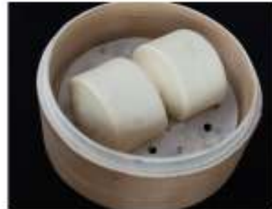
17/ Pane orientale €2,00 Pane cinese a doppia lievitazione Allergeni: 1, 7