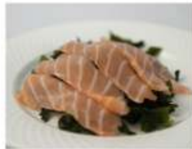
22/ Alghe sashimi €6,50 Salmone con alghe e salsa giapponese Allergeni: 14