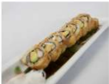
69/ California fritto (8pz) €9,00 Roll di riso fritto, farcito con surimi gambero cotto e avocado Allergeni: 2, 11