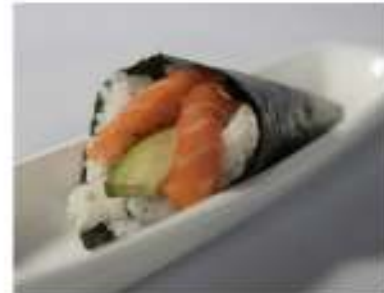
94/ Temaki sake €3,50 Cono di riso avvolto da alga nori farcito con salmone e avocado