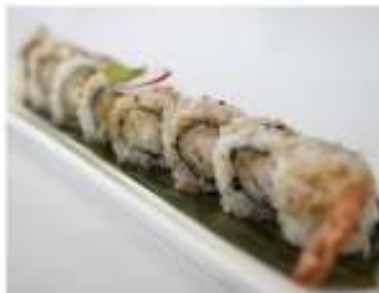
70/ Uramaki ebiten (8pz) €9,00 Roll di riso farcito con gamberoni fritti maionese e salsa teriyaki Allergeni: 1, 2, 3, 6, 11