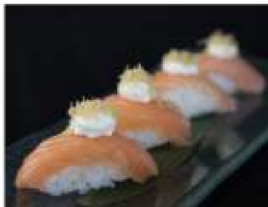
105/ Nigiri speciale (4pz) €6,00 Salmone con philadelphia e pasta kataifi Allergeni: 7