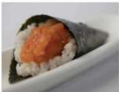
95/ Temaki spicy salmon €4,00 Cono di riso avvolto da alga nori con tartare di salmone e salsa piccante Allergeni: 3