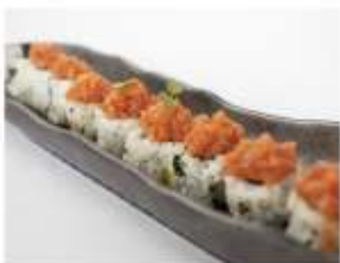
63/ Uramaki spicy tuna (8pz) €11,00 Roll di riso farcito con tonno maionese e tobiko(piccante) Allergeni: 3, 11