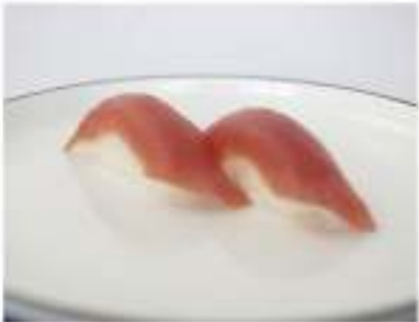
123/ Nigiri maguro (2pz) €4,00 Bocconcini di riso con tonno