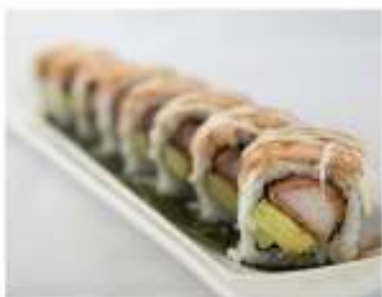
83/ Uramaki speciale (8pz) €12,00 Roll di riso farcito con surimi di granchio, gambero cotto, avocado maionese guarnito con salmone scottato e salsa teriyaki Allergeni: 1, 2, 3, 6