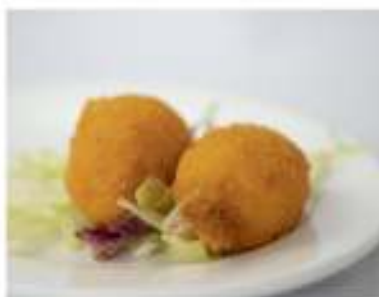
08/ Chele di granchio €3,00 Alleggereni: 1, 2