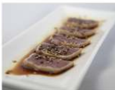
31/ Tonno tataki €10,00 Tonno scottato con sesamo condito con salsa ponzu Allergeni: 6, 11