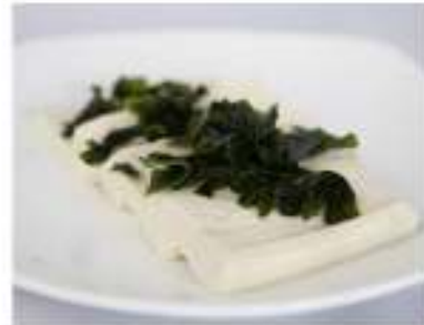
29/ Goma dofu €3,00 Tofu in insalata con salsa di soia Allergeni: 6