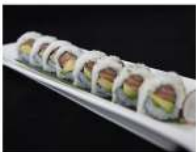
60/ Uramaki sake avocado (8pz) €8,00 Roll di riso farcito con salmone e avocado Allergeni: 11