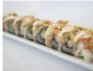
82/ Uramaki tiger speciale (8pz) €12,00 Roll di riso farcito con gambero fritto e avocado avvolto con salmone scottato e mandorle Allergeni: 1, 2, 6, 8