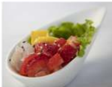
35/ Esotic tartare €9,00 Tartare di pesce misto e frutta Allergeni: 11