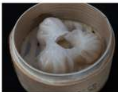
11/ Ravioli di cristallo €4,50 Ravioli di gamberi Alleggereni: 1, 2