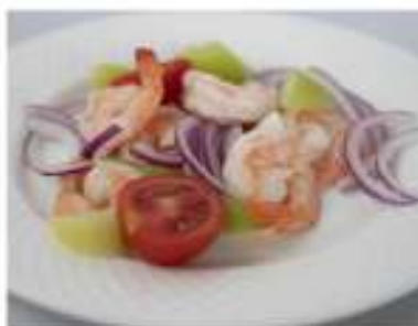
24/ Insalata di gamberi €6,50 Cipolla, pomodorini, sedano e gamberi cotti Allergeni: 2, 9