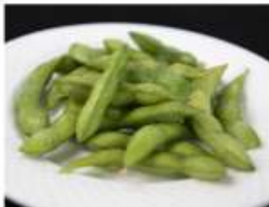
28/ Edamame €3,50 Bacelli di soia Allergeni: 6