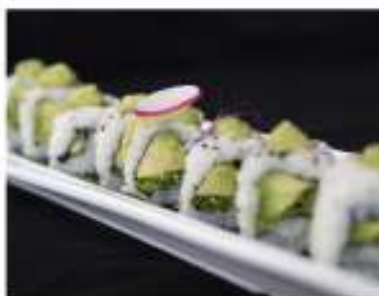
66/ Uramaki vegetale (8pz) €8,00 Roll di riso farcito con avocado insalata, cetriolo e salsa di rucola Allergeni: 11