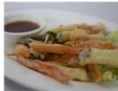
169/ Kariage €9,00 Verdure miste fritte e gamberi Allergeni: 1, 2