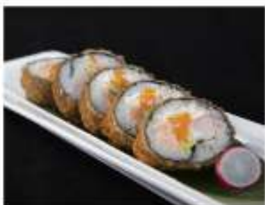
52/ Futo fritto (5pz) €6,50 Roll di riso con salmone, surimi di granchio, philadelphia, tobiko avvolti con alga nori, avocado, fritti e guarniti con salsa teriyaki Allergeni: 1, 2, 6, 7