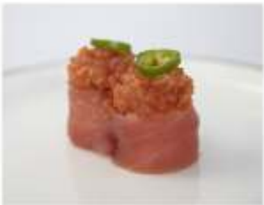
131/ Gunkan spicy tuna €5,00 Bocconcini di riso avvolti con tonno guarniti con tartare di tonno e salsa piccante