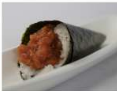
96/ Temaki spicy tuna €4,00 Cono di riso avvolto da alga nori con tartare di tonno e salsa piccante Allergeni: 3