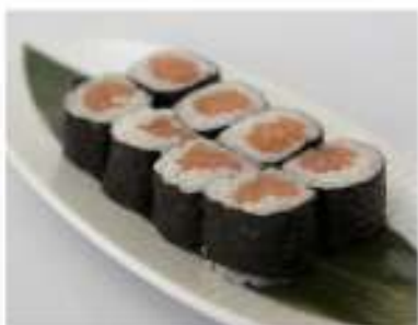
48/ Hosomaki sake (8pz) €4,50 Roll di riso farciti con salmone e avvolti con alga nori