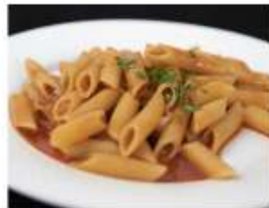
162/ Penne al pomodoro €6,00 Allergeni: 1