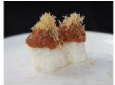
140/ Tamarizushi maguro €5,00 Bocconcini di riso con tartare di tonno e maionese Allergeni: 3