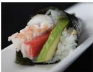
98/ Temaki california €3,50 Cono di riso avvolto da alga nori con surimi di granchio, gambero cotto, avocado e maionese Allergeni: 2, 3, 11