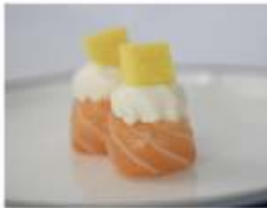
132/ Gunkan sake mango €10,00 Bocconcini di riso avvolti con salmone guarniti con philadelphia e mango Allergeni: 7