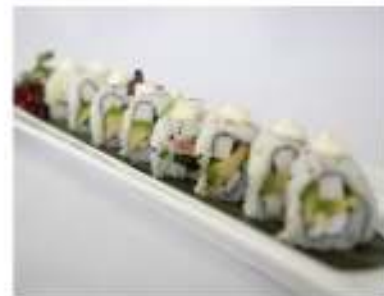
68/ Uramaki california (8pz) €9,00 Roll di riso farcito con surimi gambero cotto e avocado Allergeni: 2, 11