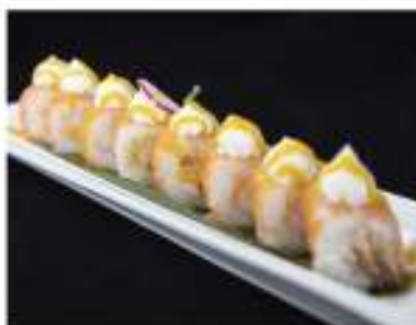
89/ Ebi fresh (8pz) €10,00 Roll di riso con tempura di gamberoni maionese, guarnito con salmone philadelphia e salsa mango Allergeni: 1, 2, 3, 7