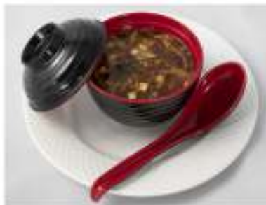
34/ Zuppa agropiccante €3,00 Zuppa di verdure in salsa agropiccante con tofu e uovo Allergeni: 3