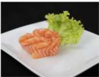
117/ Sashimi salmone €10,00 Fettine di salmone