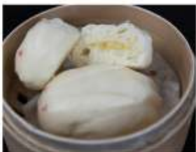
20/ Pane dolce €2,50 Allergeni: 1, 3, 7