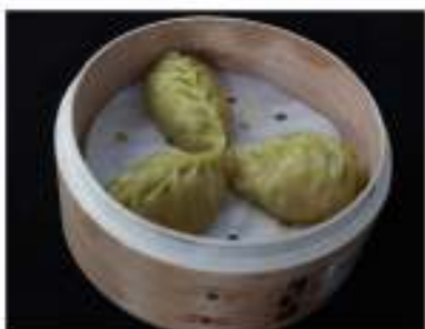
10/ Ravioli di verdure €3,00 Alleggereni: 1