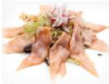
115/ Carpaccio sake scottato €12,00 Fettine di salmone scottato condite con salsa ponzu Allergeni: 6, 11