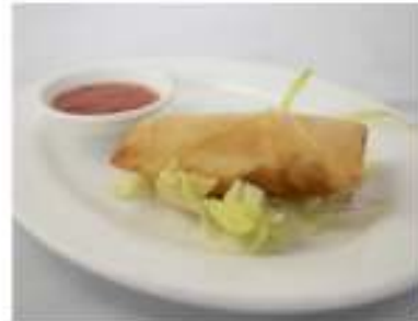
03/ Involtino primavera €2,20 Croccante involtino di pasta con ripieno di crauti e verdure miste Alleggereni: 1, 2, 3, 11