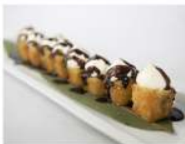
43/ Hosomaki special banana (8pz) €7,00 Roll di riso avvolti con pasta di riso farciti con banana e guarniti con cacao e philadelphia Allergeni: 11, 7