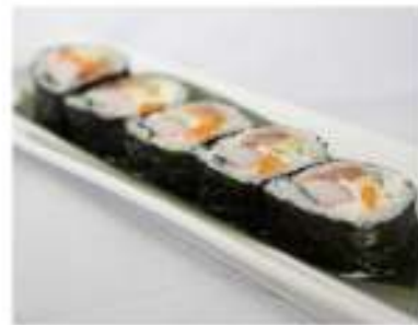
50/ Futomaki california (5pz) €6,00 Roll di riso farciti con surimi di granchio, salmone, philadelphia, avocado, tobiko, avvolti con alga nori Allergeni: 2, 7