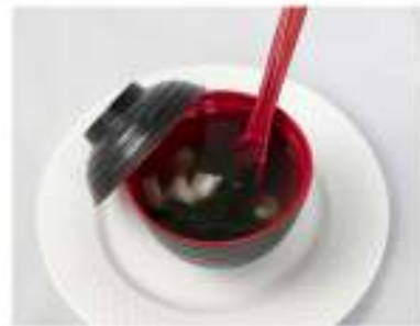
32/ Zuppa di pesce €4,00 Zuppa di pesce con miso Allergeni: 14