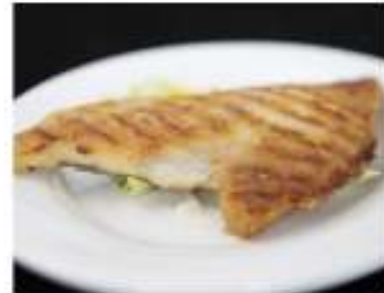
165/ Orata alla griglia €6,50