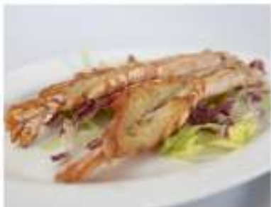
163/ Gamberoni alla griglia €9,00 Allergeni: 2