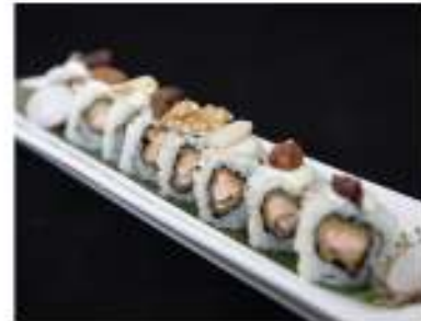
59/ Uramaki bb mix salmone (8pz) €9,00 Roll di riso farcito con salmone fritto e maionese guarnito con BB mix e salsa teriyaki Allergeni: 3, 6, 8, 11