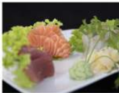
118/ Sashimi misto €10,00 Fettine di salmone, tonno e pesce bianco