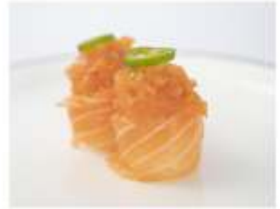
133/ Gunkan spicy sake €5,00 Bocconcini di riso avvolti con salmone, guarniti con tartare di salmone e salsa piccante