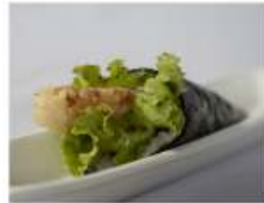
97/ Temaki ebiten €4,00 Cono di riso avvolto da alga nori con gamberoni fritti, maionese salsa teriyaki e insalata Allergeni: 1, 2, 3, 6