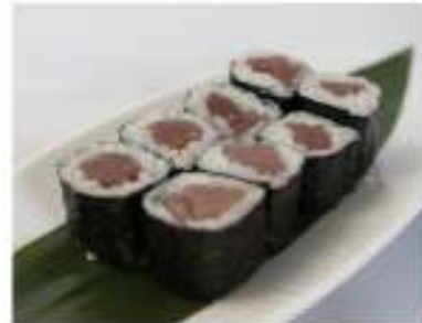
47/ Hosomaki tekka (8pz) €5,00 Roll di riso farciti con tonno e avvolti con alga nori