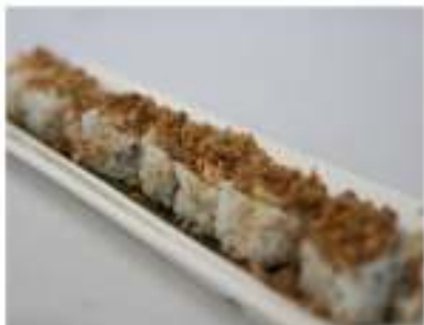
57/ Miura maki (8pz) €8,00 Roll di riso farcito con salmone saltato avocado, philadelphia, ricoperto da cipolla fritta e guarnito con salsa teriyaki Allergeni: 6, 7, 11