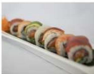
73/ Rainbow roll (8pz) €12,00 Roll di riso farcito con salmone avocado, guarnito con pesce misto