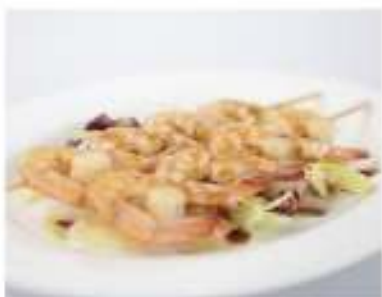
200/ Spiedini di gamberetti €7,00 Allergeni: 2