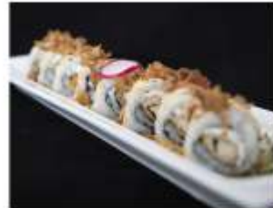
80/ Chicken roll B (8pz) €8,50 Roll di riso farcito con pollo fritto philadelphia, salsa rosa, ricoperto da cipolla fritta Allergeni: 1, 6, 7, 11