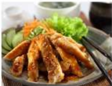
179/ Pollo teriyaki €7,00 Allergeni: 2