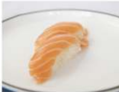
124/ Nigiri sake (2pz) €3,00 Bocconcini di riso con salmone