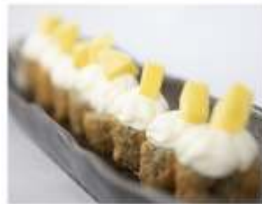
41/ Hosomaki mango (8pz) €6,00 Roll di riso avvolti con alga nori fritti, farciti con salmone e guarniti con philadelphia, mango fresco e salsa teriyaki Allergeni: 1, 6, 7