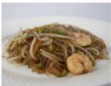
157/ Spaghetti di soia con gamberi e verdure €5,00 Allergeni: 1, 2, 6