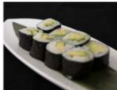
44/ Hosomaki avocado (8pz) €4,00 Roll di riso farciti con avocado e avvolti con alga nori