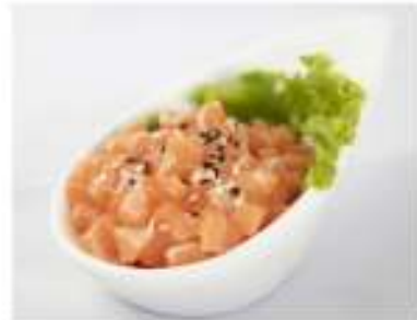
36/ Sake tartare €8,00 Tartare di salmone con salsa ponzu Allergeni: 6, 11