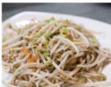
190/ Germogli saltati €4,00