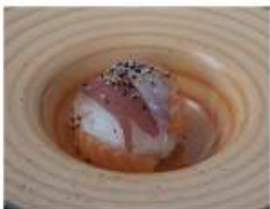
111/ Chirashi misto €12,00 Base di riso con sashimi misto Allergeni: 11