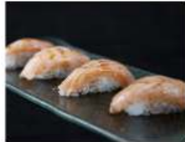
106/ Nigiri scottato (4pz) €6,00 Salmone scottato e salsa teriyaki Allergeni: 6