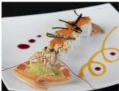
55/ Scampi roll (4pz) €14,00 Roll di riso con scampi e asparagi fritti con alga, salsa teriyaki e salsa rosa Allergeni: 2, 3