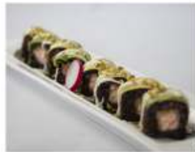
87/ Special pistacchi roll (8pz) €10,00 Roll di riso venere farcito con salmone fritto, maionese, ricoperto da avocado e pistacchi Allergeni: 1, 3, 8