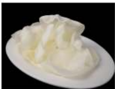
05/ Nuvole di drago €1,50