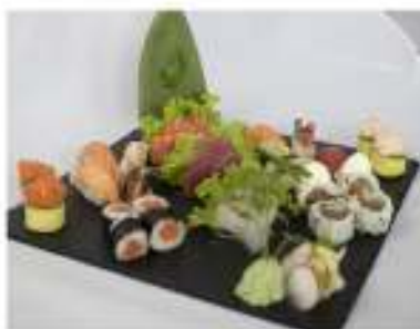
109/ Sushi sashimi speciale €28,00 8 nigiri, 4 gunkan, 2 uramaki 4 hosomaki, 9 sashimi Allergeni: 2