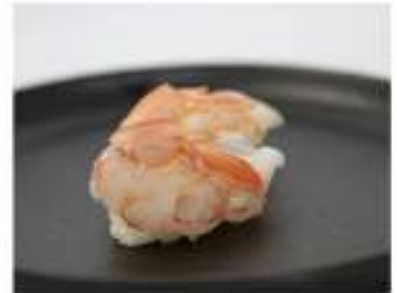
122/ Nigiri amaebi (2pz) €4,00 Bocconcini di riso con gambero crudo Allergeni: 2