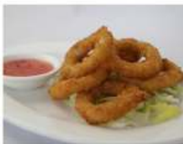
177/ Calamari fritti €7,50 Allergeni: 1, 3, 14